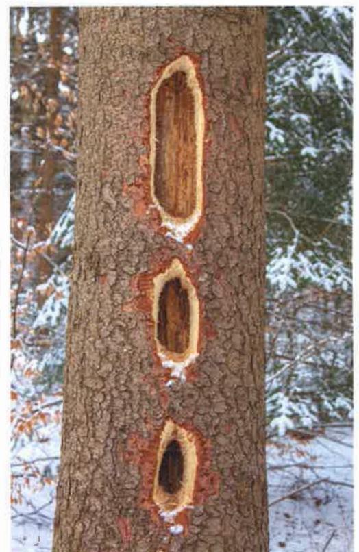
Spillkråkan har hackat decimeterdjupt i en rotrötad gran där det bor hästmyror. Skulle du kunna hacka sådana hål med en morakniv? Tror inte det.

Även om spillkråkan förekommer i landskap med omfattande skogsbruk så finns det tydliga faktorer där som missgynnar arten: korta omloppstider, tätta och unga ensartade produktionsskogar och bristen på grövre överståndare av främst asp och tall, men även bok. Brist på boträd kan leda till att spillkråkan tvingas nyttja samma träd som tidigare, något som ökar risken för boplundring av