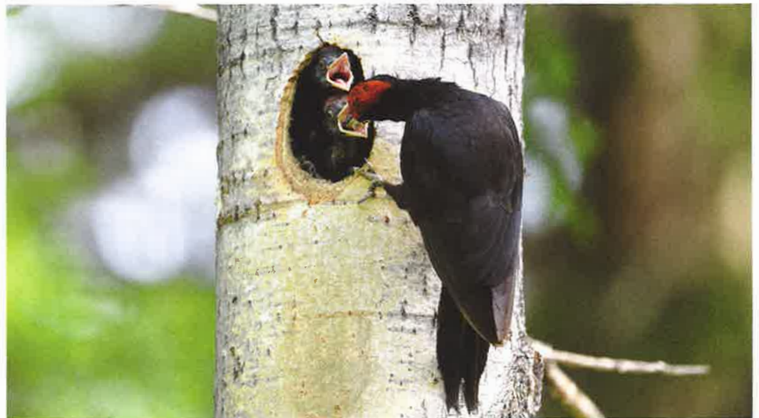
Aspen är ett viktigt träslag för spillkråkor att hacka ut bo i.

Spillkråkan finns i såväl barr- och blandskogar som i rena lövbestånd. De bästa miljöerna innehåller ett stort inslag av gamla och döda träd och den viktigaste faktorn är grova träd för