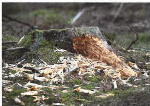
Spillkråkan "spiller" stora flisor omkring sig när den letar efter föda. Även stubbar på hyggen utnyttjas.

Grunden för att spillkråkan ska trivas är god generell hänsyn där sparande av lämpliga boträd samt träd som får utvecklas till framtida boträd är viktigast. Man kan också göra förbättringsåtgärder som att frihugga grova tallar och gallra fram asp som får utvecklas fritt utan att tas ned senare. Att minska störningen vid en boplats är något annat man bör tänka på. Rekommendationen från Skogsstyrelsen är att undvika skogliga åtgärder inom 100 meter från boet under perioden mars-juni. Enbart fynd av spillkråka motiverar inte ett