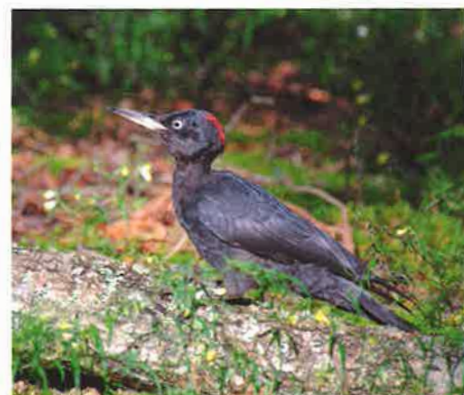
Spillkråkan söker ofta föda i marknivå, som här bland grenar på marken.