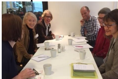
Styrelsen hos LRF i Stockholm.