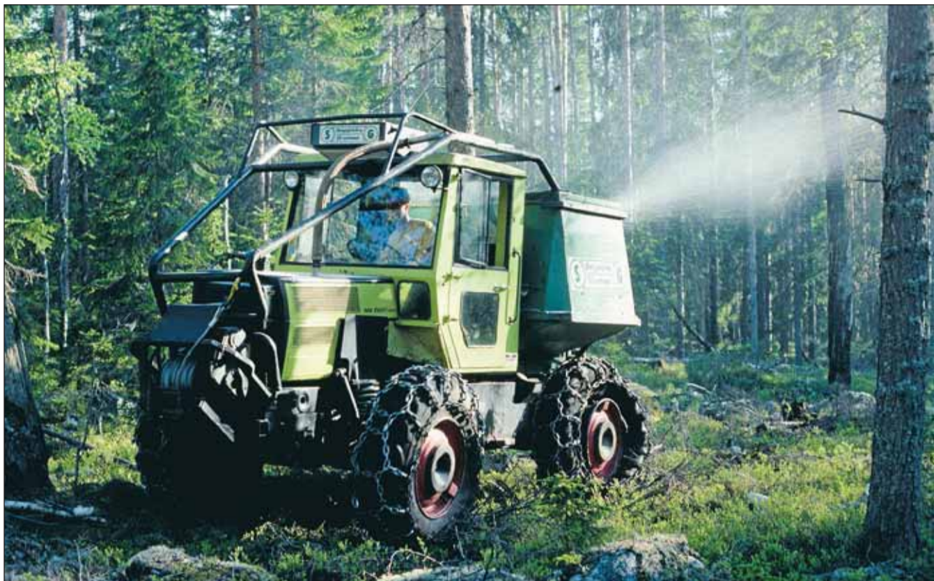
En normal gödselgiva ligger på 150 kilo kväve per hektar. Den kan både spridas maskinellt på marken och från luften med helikopter.