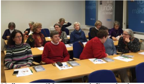
Medlemmar ur Skånestammen inför seminariet